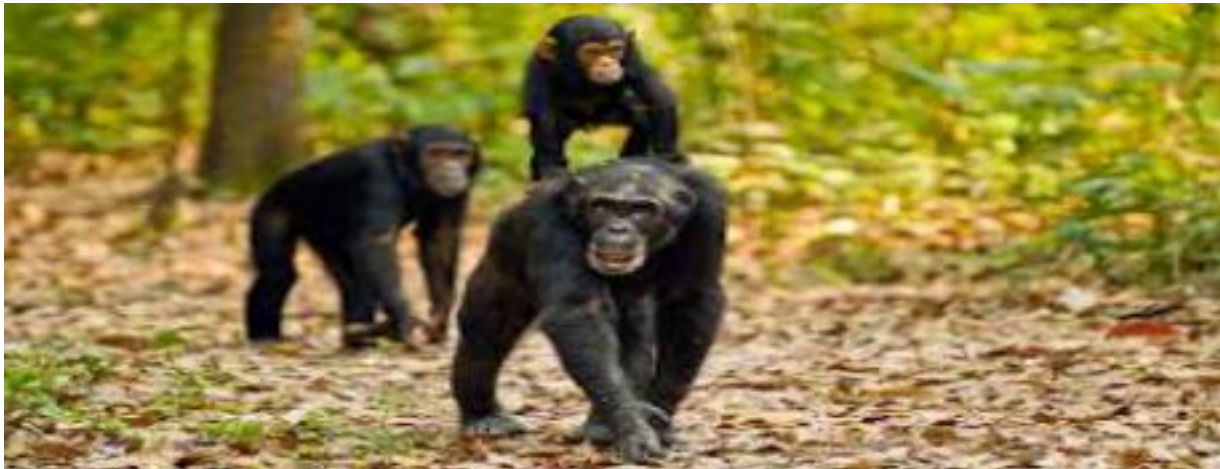
Sokwe katika Hifadhi ya Taifa ya Gombe Mkoani Kigoma

Uwepo wa hifadhi ya milima ya Mahale na misitu ya Gombe yenye Sokwe adimu (Well researched Chimpanzee), hifadhi ya wanyama ya Muyowosi, njia ya biashara ya watumwa (Kigoma-Bagamoyo slave trade route), Makumbusho ya Dkt. Livingstone na Stanley, Ziwa Tanganyika, Meli ya Mv Lihemba, Hotel za Kitalii (Lake Tanganyika Beach Hotel, Hill Top Hotel na Green View Hotel) ni fursa kwa uwekezaji wa Kitalii hasa katika Hoteli za Kitalii, Kampuni za kuongoza watalii, Kituo cha utalii, beach za kisasa na usafiri wa haraka wa majini (Fast farries)