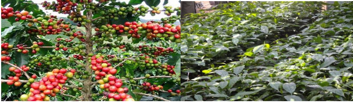
Zao la Kahawa aina ya Arabica linalostawi kwa wingi Mkoani Kigoma

Aidha Halmashauri ya Uvinza kwa kushirikiana na TACRI-TANZANIA COFFEE RESEARCH INSTITUTE (Taasisi ya utafiti ya kahawa) ilifanya utafiti wa udongo ili kubaini kwa uhakika eneo linalofaa kwa kahawa. Utafiti ulionyesha kuwa maeneo yanayofaa ni mengi hivyo bado kuna fursa kubwa ya kuwekeza katika zao hilo.