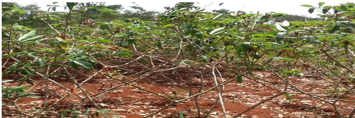
Kilimo cha zao la Muhogo Mkoani Kigoma

Ustawi wa zao la Muhogo ni fursa kwa kupanua kilimo cha zao la muhogo na uanzishaji wa kiwanda cha kuchakata mazao ya kilimo kama muhogo. Zao la muhogo ni zao ambalo hutupatia bidhaa ya unga kwa ajili ya chakula na unga wake hutumika sana maeneo mbalimbali ya Tanzania. Katika Mkoa wa Kigoma maeneo yanayolima zao la muhogo kwa wingini Mahembe, Kazuramimba na Kidahwe, Kibondo, Kasulu, Buhigwe, Uvinza na Kakonko, sehemu hizo zina idadi kubwa ya wakulima wa zao hilo la muhogo na katika sehemu hizo miundo mbinu ya barabara, maji, huduma ya umeme zinaimarishwa. Sehemu kubwa ya muhogo ghafi (Makopa) unaozalishwa inauzwa nchi jirani ya Burundi. Kwa takwimu za mwaka 2015, eneo linalolimwa muhogo katika Mkoa kwa sasa ni hekta 126,933 na wastani wa uzalishaji kwa mwaka ni tani 545,922.