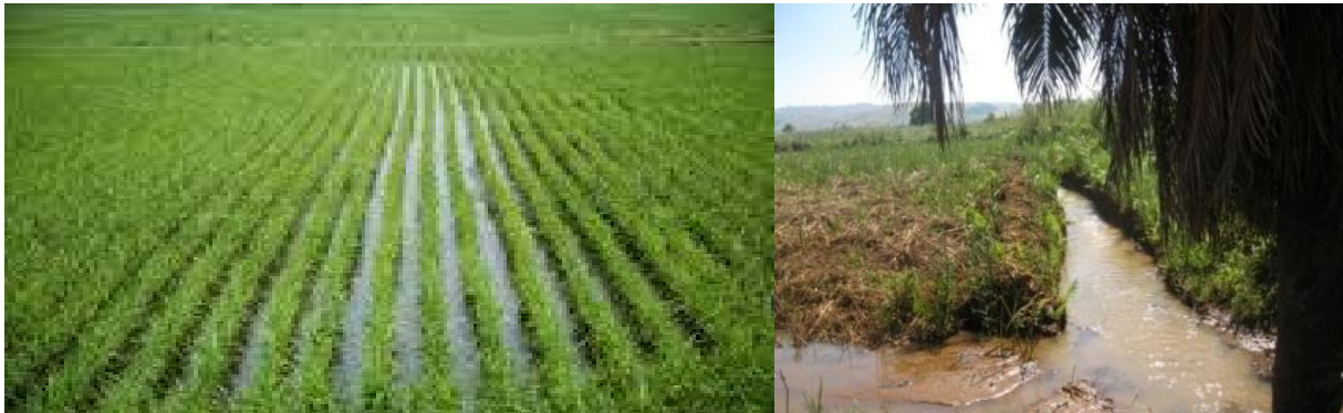
Kilimo cha zao la mpunga Mkoani Kigoma

Mkoa una Hekta 50,952 zinazofaa kwa kilimo cha Mpunga na mazao mbalimbali yanayofaa kilimo cha umwagiliaji. Kwasasa ni Hekta 8,219.5 tu sawa na 16% ndizo zinazotumika. Hivyo 84% ya eneo linalofaa kwa kilimo cha umwagiliaji ambalo halijatumika ni fursa kwa uwekezaji wa kilimo cha umwagiliaji na kilimo cha zao la mpunga.