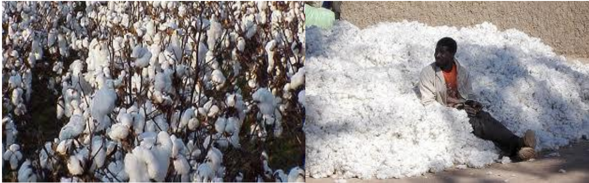
Kilimo cha zao la Pamba Mkoani Kigoma

Ustawi wa kilimo cha Pamba ni fursa kwa kupanua kilimo cha pamba na uanzishaji wa kiwanda cha nguo. Mkoa wa Kigoma katika Wilaya ya Kakonko na Kibondo vijiji ishirini vimetambulika kuwa na uzalishaji wa pamba kwa eneo zaidi ya hekta 230 kwa kakonko na hekta 14,000 kwa Wilaya ya Kibondo. Kwa sasa wastani wa paamba inayozalishwa katika Mkoa ni tani 93 kwa mwaka na eneo linalotumika kwa kilimo cha pamba linakadiriliwa kuwa hekta 66. Miundombinu ya barabara, maji, bandari na kiwanja cha Ndege katika Mkoa vinapatikana.