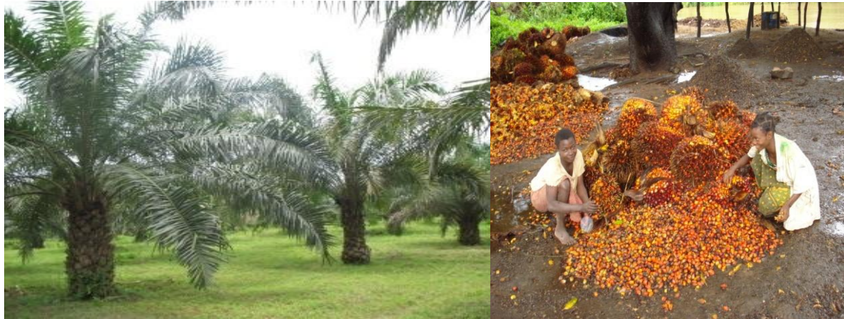
Kilimo cha zao la michikichi katika Mkoa wa Kigoma

matunda ya mchikichi kwa mwaka. Wawekezaji wanakaribishwa kuwekeza kwenye kilimo cha kisasa cha michikichi na uchakataji wa matunda ya michikichi.