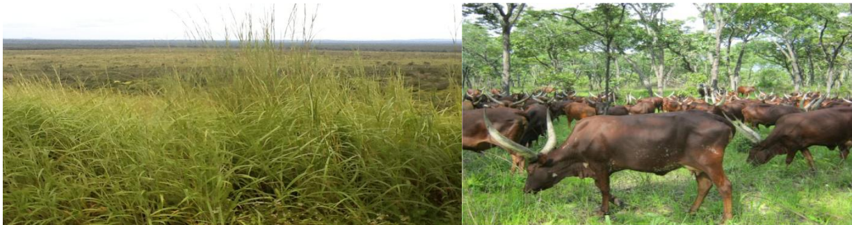
Maeneo ya malisho ya mifugo na ng'ombe wakiwa malishoni Wilayani Kasaulu

ng'ombe 586,686, mbuzi 595,104 na kondoo 103,346. Hivyo uwepo wa malisho na idadi kubwa ya mifugo ni fursa kwa uanzishaji wa kiwanda cha nyama, ngozi na maziwa. Aidha, Mkoa una zaidi ya hekta 1,000 zinazofaa kwa uwekezaji katika sekta ya mifugo ambapo Wilaya ya Kakonko ina hekta 806 zinazofaa kwa uwekezaji husika ambapo ujenzi wa machinjio ya kisasa (Abbatoir) na ujenzi wa kiwanda cha kusindika ngozi/ utengenezaji wa bidhaa za ngozi na usindikaji wa nyama na mazao mengine ya mifugo unaweza kufanyika. Halmashauri ya Mji wa Kasulu ina hekta 12 kwa ajili ya ujenzi wa mnada wa kisasa wa mifugo na ujenzi wa kiwanda cha kusingika ngozi na mazao mengine ya mifugo.