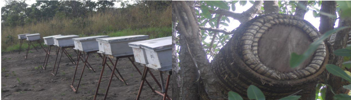
Mizinga ya kisasa katika kijiji cha Basanza-Uvinza na Mzinga wa asili katika kijiji cha Mwamila-Uvinza

Kwa sasa Mkoa una mizinga ya kisasa 6,521 na ya asili 114,825. Kwasasa uzalishaji wa asali ni wastani wa tani 472 na uzalishaji wa nta ni wastani wa tani 17 mwaka.