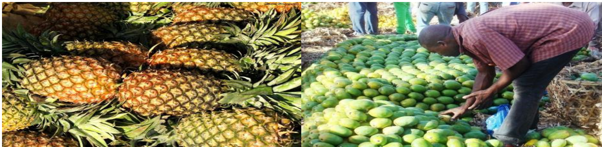
Miongoni mwa matunda mbalimbali yanayozalishwa kwa wingi Mkoani Kigoma

Uwepo wa uzalishaji mkubwa wa matunda ya aina mbalimbali ni fursa kwa uanzishaji wa kiwanda cha kusindika matunda. Mkoa wa Kigoma katika maeneo yake ya Wilaya za Kasulu, Buhigwe, Kibondo kuna zaidi ya hekta 1,350 zinazofaa kwa uzalishaji wa matunda.